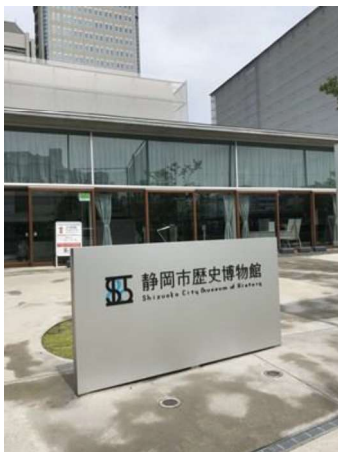
静岡市歴史博物館